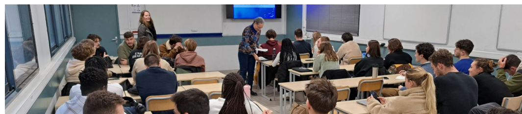
[PROGRAMME DES ACTIVITÉS DE MONTPEL'LIBRE]

19h00-19h45 (UTC+1) Plénière de clôture À Abidjan, Béjaïa, Dakar, Lomé, Meknès, Niamey, Montpellier, Montréal, Ouagadougou, Québec et Sfax ainsi que les participants des autres villes qui le souhaitent, échangent sur l'édition 2024 des Rencontres Amicales Francophones du Logiciel libre et lancent des pistes de réflexions pour la prochaine édition. Intervenants : Ouvert à toutes et à tous.